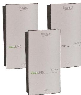
Tootenr 1530 / 1533 / 1536