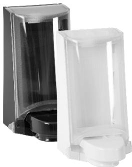
Tootenr 4552 / 4551