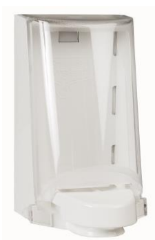
Art. nr 4551