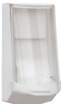
Art. nr 4546 Automaatne dosaator