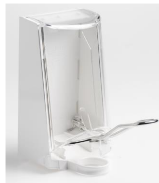
Art. nr 4567